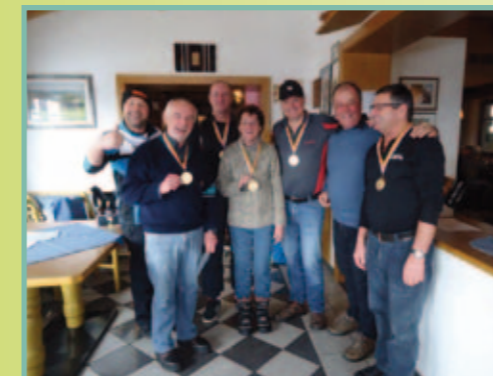
Eisstock – Vereinsmeister 2016