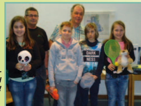
„MÄDN“ 2016 – Auch die Jugend war dabei!