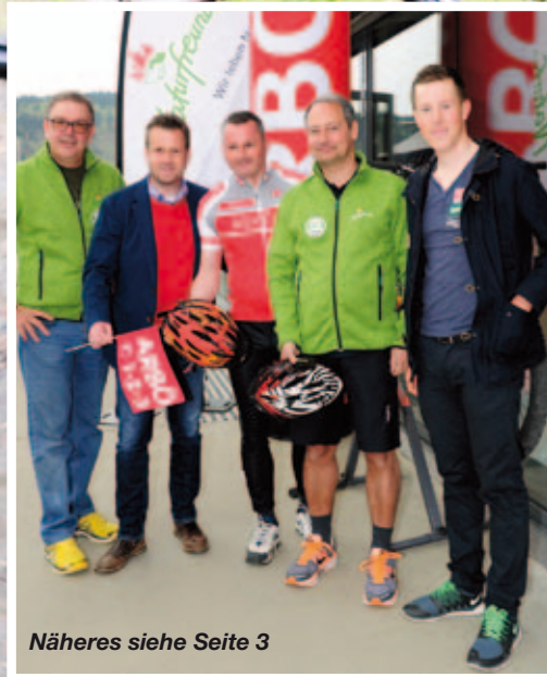
Näheres siehe Seite 3