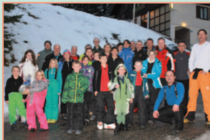
Kleinkinderschikurs auf der Fini-Planai