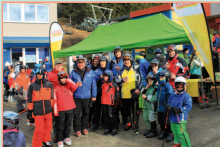
Landes-Wintersporttag am Klippitztörl